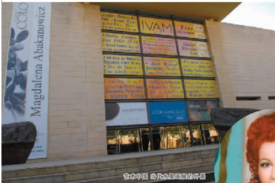
艺术中国 当代水墨画展的外景